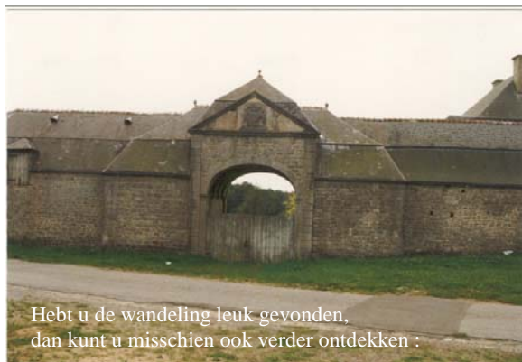
Hebt u de wandeling leuk gevonden, dan kunt u misschien ook verder ontdekken :